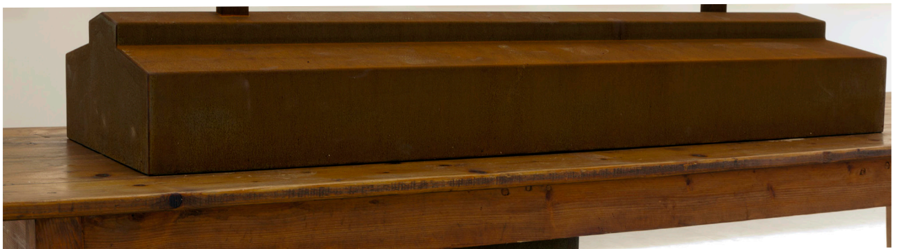
Tracing Martin Heidegger's hut and Paul Celan's clouds, 2011